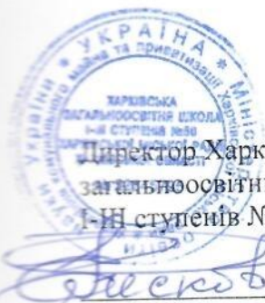
Директор Харківської загальноосвітньої школи I-III ступенів № 60